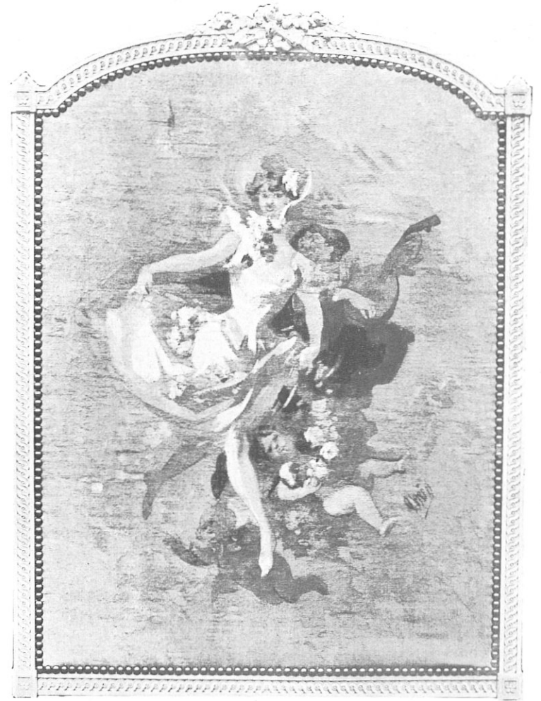
LA DANSEUSE JAUNE (Écran en tapisserie).