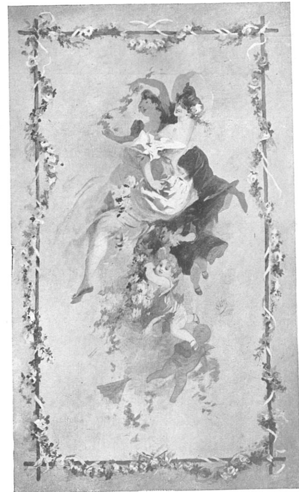
LES ROSES (Tapisserie des Saisons).