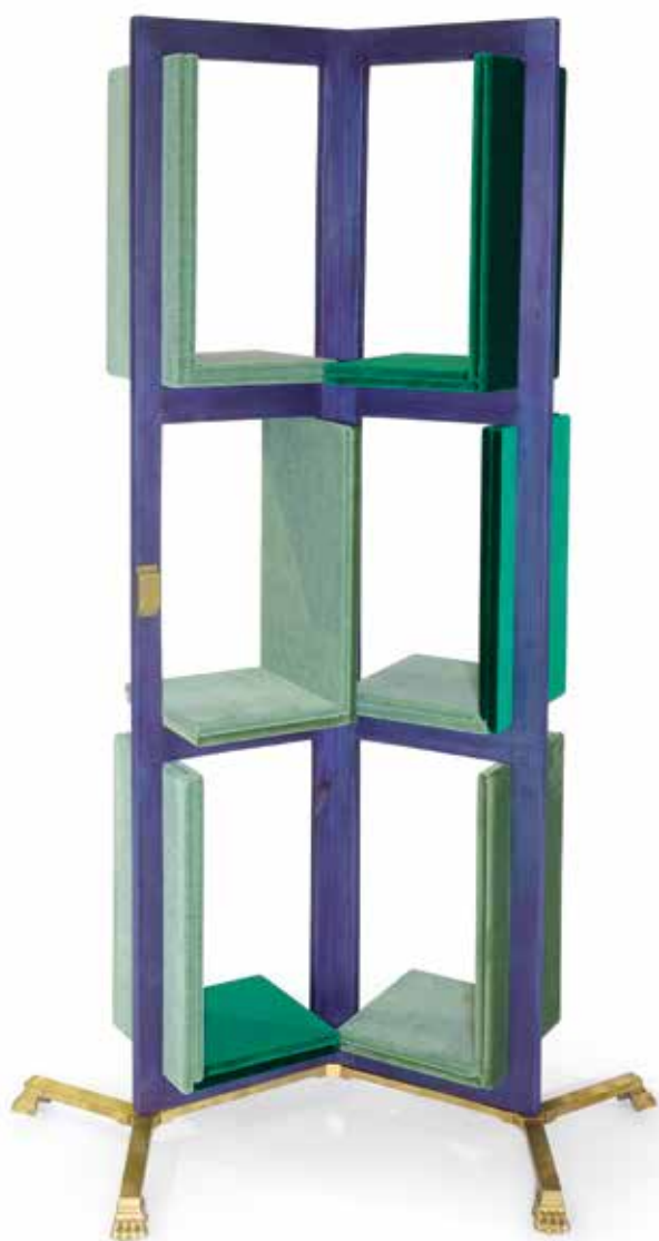
Matino Gamper, Bleu-Vert-Shelf, 2026 154,5x94x62,2 cm

Achat par commande à l'artiste en partenariat avec le Mobilier national, réalisé par l'artiste dans la Chapelle Saint-Louis du Mobilier national. 3 pièces présentées